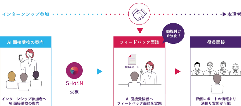
インターンシップ（早期選考）活用フロー

「役員 4 人が、事前に同じ情報量を持って面接に臨めるというのは AI 面接ならではの部分ですね。普通の面接では聞き取れない内容を AI が聞き取り、それが点数化されているのも魅力です。AI 面接は学生の情報をより詳しく得るために使います。一方で、インターン期間中は仕事をしてもらいながら、よく話をします。そうした会話や最終面接を通して、学生がこの会社でこの人と働きたい、という志望意欲を上げられるようにするのは、やはり人間の役割だと思います。それぞれの長所を上手く使い分けながら、今後も AI 面接を使っていきたいですね」